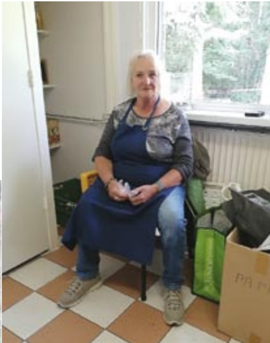
Coby het toilet is weer vrij

Tot groot genoegen van de penningmeester die met een schuin oog de munten uitgave, uitstekend verzorgt door Klaasje en Aafje, in het oog hield.